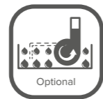
BUILT-IN DRAIN PUMP OPTIONAL