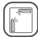
MULTIPLE INSTALLATION TYPES