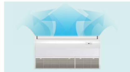
CAUDAL AIRE 3D